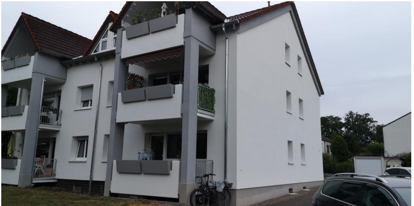
Das Objekt Albert-Einstein-Straße 23, 63538 Großkrotzenburg nach der Modernisierung

Die in den Jahren 2009 bis 2011 und 2013 angeschafften Photovoltaikanlagen tragen mit zurzeit jährlichen Erlösen von T€ 44,4 (Vorjahr T€ 40,4) zum positiven Geschäftsergebnis bei.