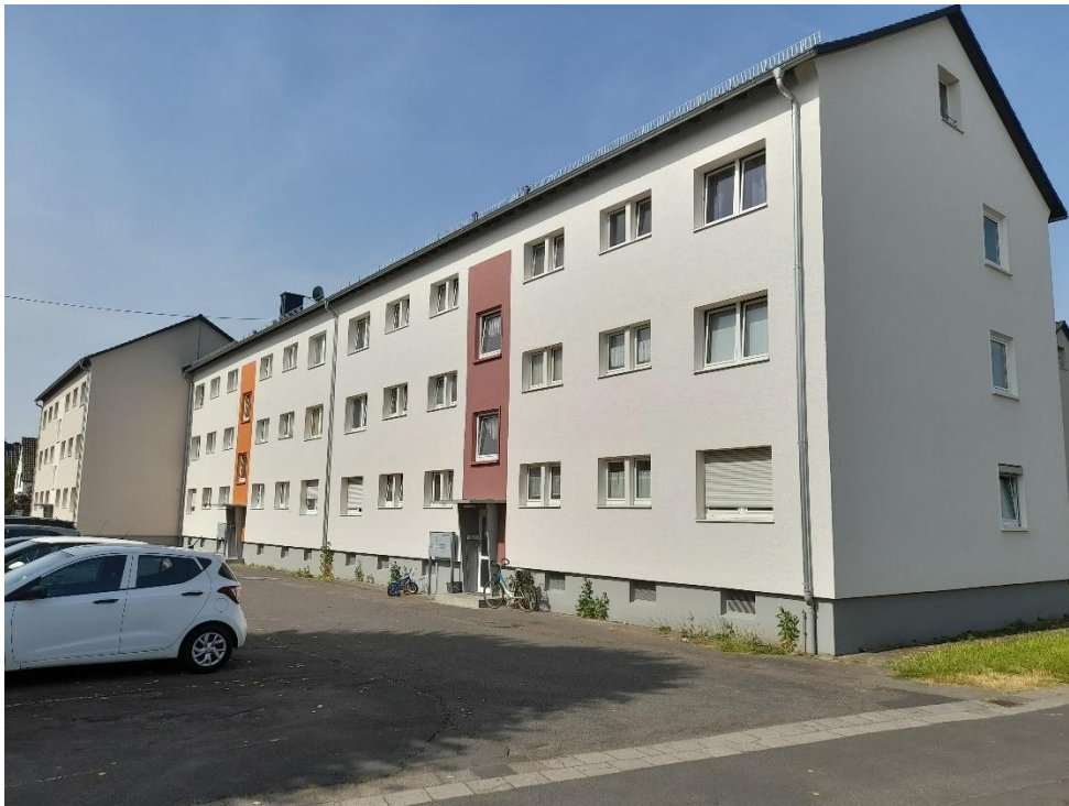
Wohnhäuser Querstr. 29-39, 63500 Seligenstadt

Im Berichtsjahr 2022 mussten an verschiedenen Häusern Reparaturen und Instandsetzungsarbeiten ausgeführt werden. Die Kosten betragen insgesamt T€ 151,4 (i.V. T€ 210,3). Auch im Jahr 2022 wurden weitere zwei Blöcke in der Querstraße 29-33 und Querstraße 35-39 saniert. Die Baukosten betragen T€ 416. Modernisiert wurde das Dach, die Fassade sowie die Haustüren nebst Briefkastenanlagen. Die letzten beiden Blöcke der Querstraße werden in 2023 saniert.